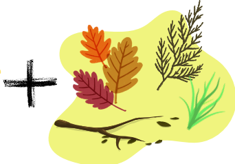
tout ce qu'on produit au jardin