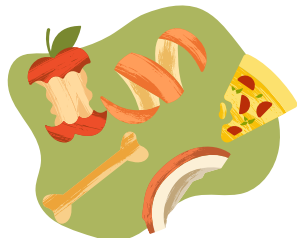
tout ce qu'on produit en cuisine

Les biodéchets, ce sont tous nos déchets organiques.